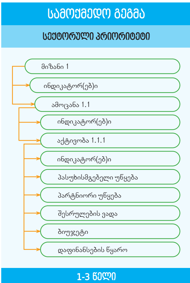
დიაგრამა 1. სამოქმედო გეგმის სტრუქტურა

გენდერული თანასწორობის მუნიციპალური სამოქმედო გეგმების შემუშავება შედეგებზე დაფუძნებული მართვის პრინციპების შესაბამისად უნდა ხდებოდეს. სასურველია, რომ გენდერული თანასწორობის მუნიციპალური სამოქმედო გეგმების შემუშავება დაეფუძნოს პოლიტიკის დოკუმენტების შემუშავების, მონიტორინგისა და შეფასების წესის დამტკიცების შესახებ საქართველოს მთავრობის დადგენილებას N629; ასევე, რეკომენდებულია, რომ აღნიშნული პროცესი საქართველოს რეგიონული განვითარებისა და ინფრასტრუქტურის სამინისტროს მიერ მუნიციპალიტეტის საშუალოვადიანი განვითარების დოკუმენტის შედგენის პრაქტიკულ სახელმძღვანელოში განვირეოთ ინსტრუქციების მიხედვით წარიმართოს.